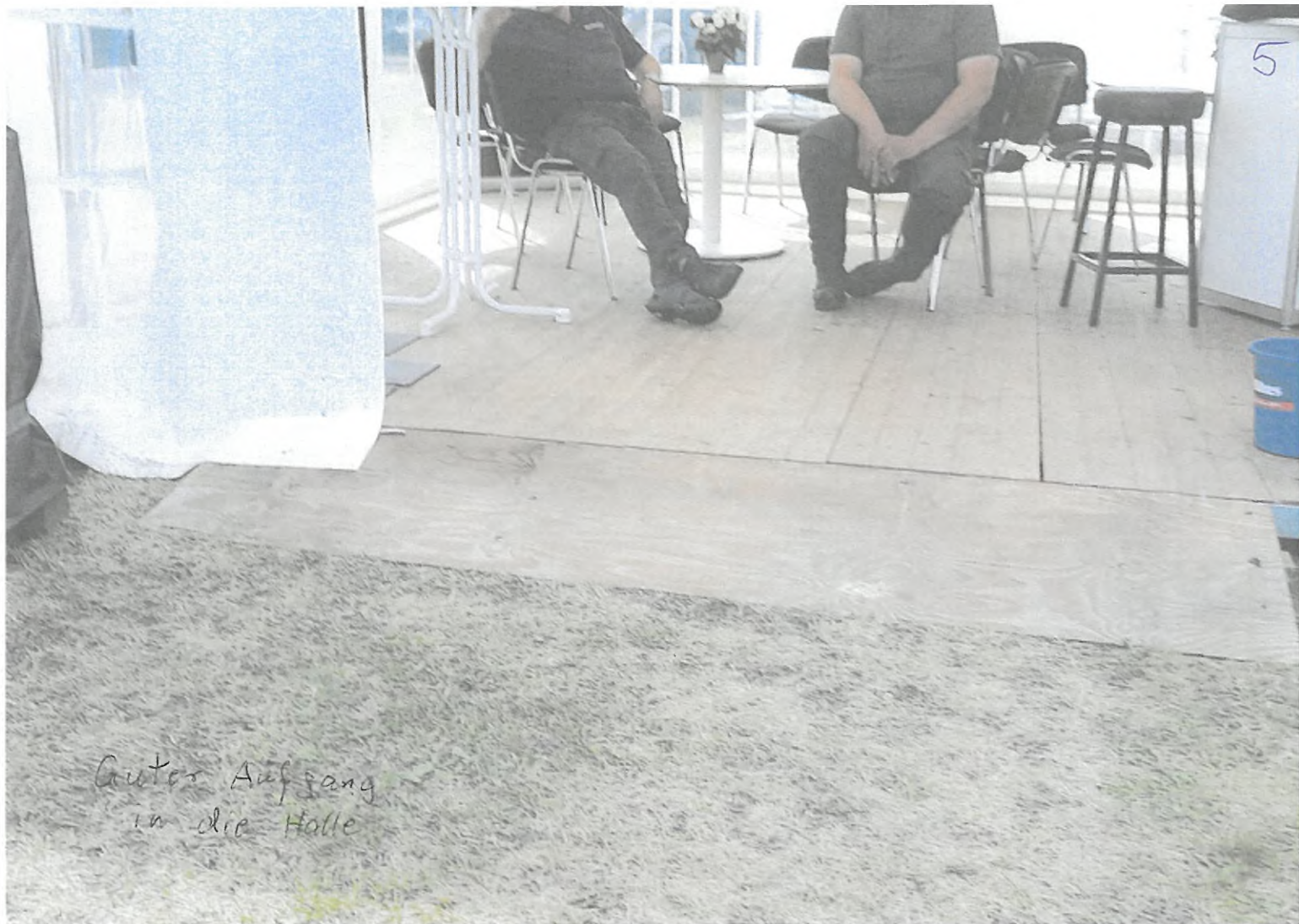
Guter Aufgang in die Halle