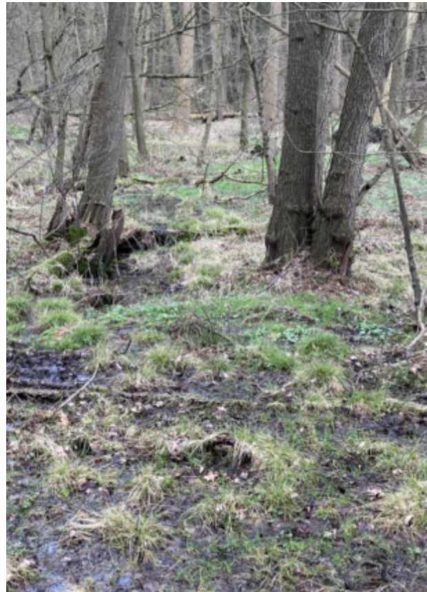
Kiefernwald mit eingestreutem Eichenwald